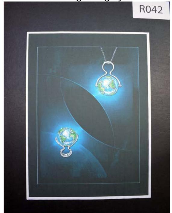
Name: Tang Yuk Ying Title: The Unique Earth