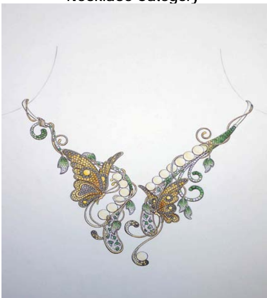
Name: Gan Soek Lan Title: Crstaylization of Love